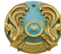
Министерство сельского хозяйства