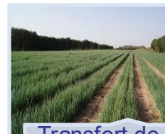
Transfert de technologie