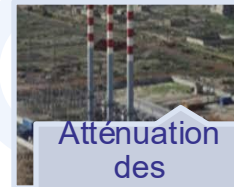
Atténuation des émissions de gaz à effet de serre