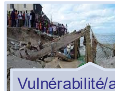
Vulnérabilité/a daptation au climat