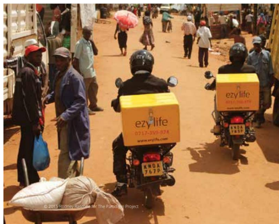
Les agents commerciaux livrent un foyer directement aux utilisateurs finaux