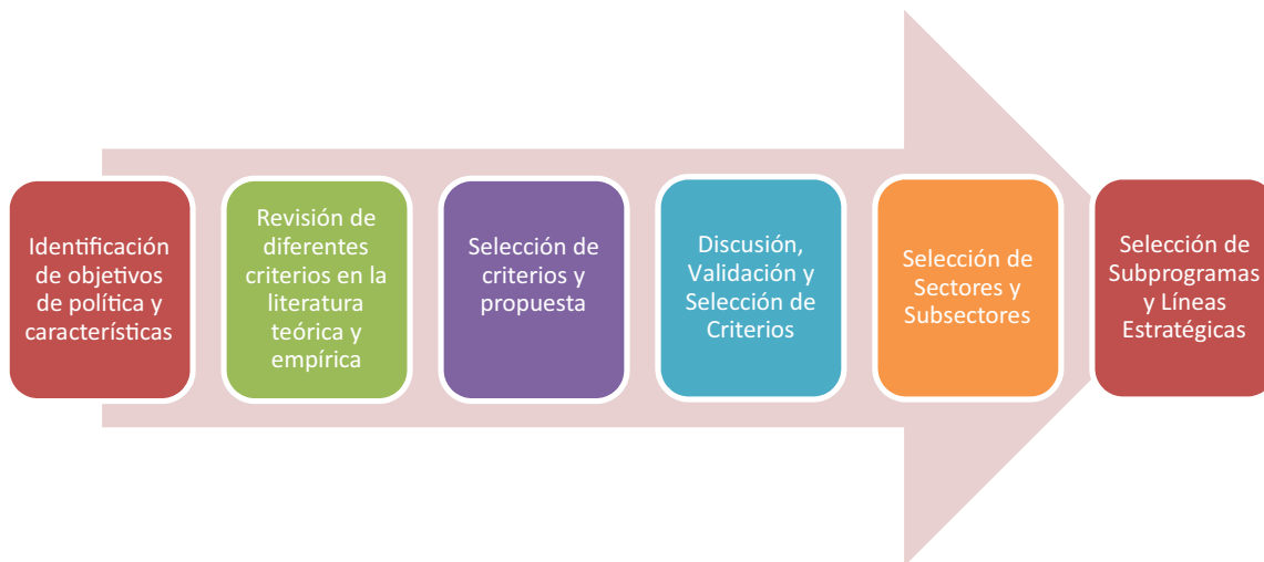
Figura 2. Metodología aplicada para la selección de nuevos subprogramas y líneas de acción

Siguiendo la experiencia empírica se propuso un conjunto de criterios para la selección de sectores, subprogramas y líneas de acción los cuales fueron validados por la contraparte, y que se muestran en la Tabla 8 . Es importante anotar que la aplicación de los criterios definidos exige ciertas condiciones habilitantes tales como: el conocimiento del potencial de eficiencia identificado, el manejo interno de las tecnologías disponibles y, especialmente en el caso del sector industrial, el consumo energético por ramas.